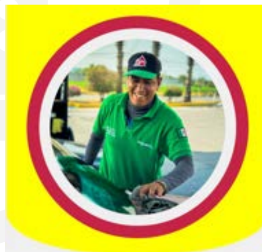
Enfoque en el cliente (CX)

Ejecutar programas de capacitación en atención al cliente diseñados especialmente para sus colaboradores.